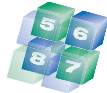
3) eCube Ergänzungsbausteine

Energiemanagement ist ein Prozess, der sich in zeitlich festgelegten Abständen regelmäßig wiederholt.